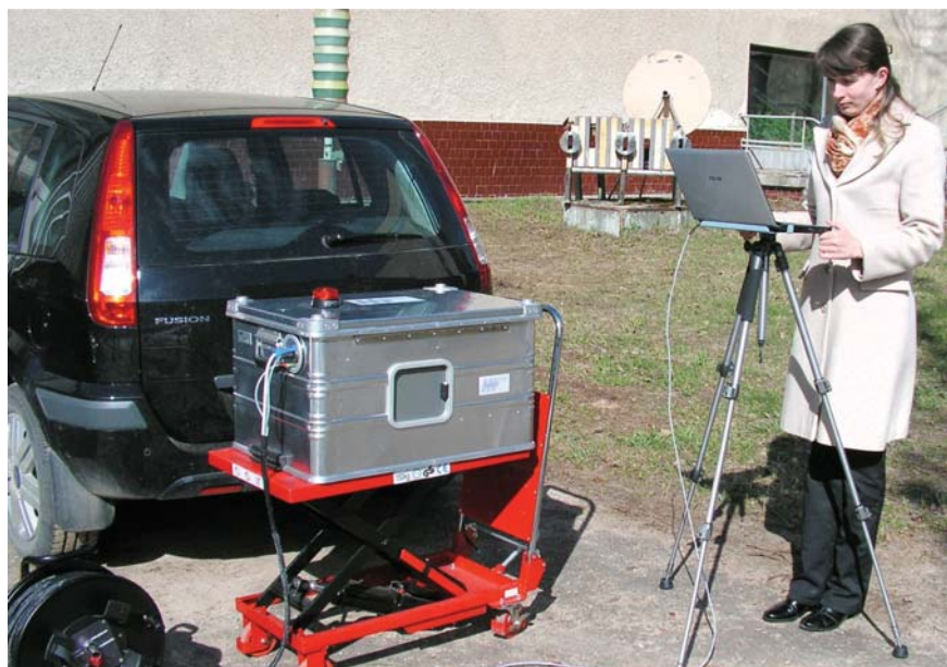
Рис. 1. Переносной детектор взрывчатых веществ ДВИН-1